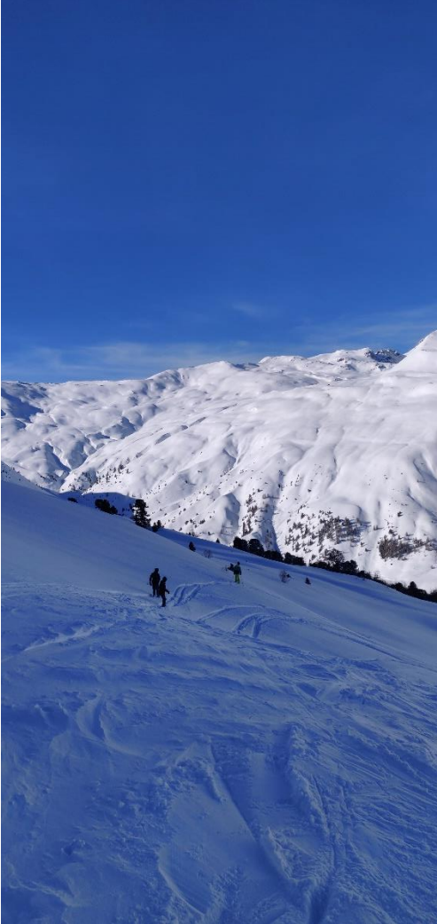
Skidåkning i Nauders