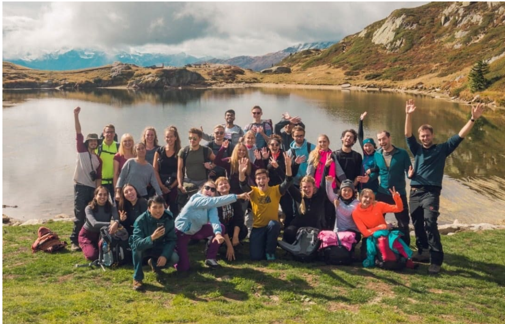
Vandring till Aletsch glaciären med ESN

Att åka på utbyte ger en möjligheten att lära känna nya människor och kulturer. Jag bodde på ett studentboende och delade kök med 16 andra studeranden. Det var mycket intressant att lära sig om olika matkulturer och ett effektivt sätt att lära känna nya vänner. De flesta universitet har också någon form av förening för utbytesstudenter, genom att delta i deras evenemang kan man lära känna andra utbytesstudenter tillika som man får uppleva nya platser och kulturen i sitt utbytesland. Jag deltog i många ESN (Erasmus Student Network) evenemang, allt från julmarknad i Frankrike till vandring vid Aletsch glaciären.